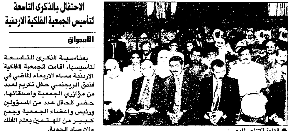
القاعة اكتظت بالمدعوين

بمناسبة الذكرى التاسعة لتأسيسها، اقامت الجمعية الفلكية الاردنية مساء الاربعا والاربعاء الماضي في فندق الراجحي حفل تكريمي لعدد من مؤازري الجمعية واصحابها، حضر الحفل عدد من المسؤولين ورؤساء واعضاء الجمعية وجمع كبير من المهتمين بعلم الفلك والارصاد الجوية.